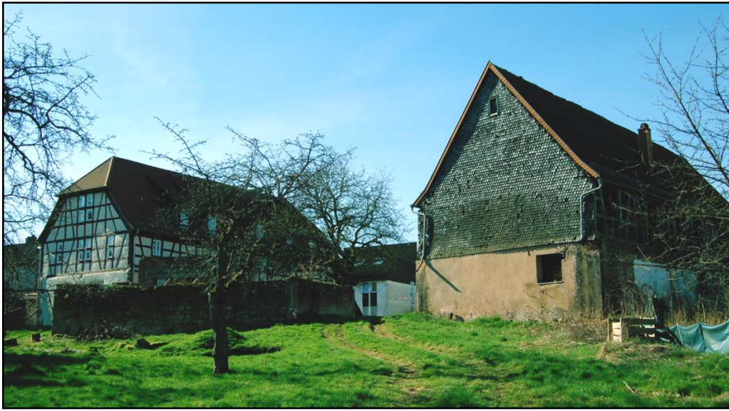
Ansicht von der Freifläche im rückwärtigen Bereich

Denkbar wäre eine Nutzung des linken Gebäudes ( Geb. 3 ) und des mittleren Gebäudes ( Geb. 2 ) als Räumlichkeiten für Geschäfts- und Büroräume, aber auch eine Umnutzung zu Wohnräumen oder der Aufbau als Gastronomiebetrieb mit Übernachtungsmöglichkeiten wäre möglich, da Heltersberg auch im Mountainbikepark Pfälzerwald eingebunden ist und überregionale Wander- und Fahrradwege durch den Ort laufen. Das in der Nähe liegende Freibad der Verbandsgemeinde könnte in den Sommermonaten ebenso für zahlreiche Besucher sorgen.