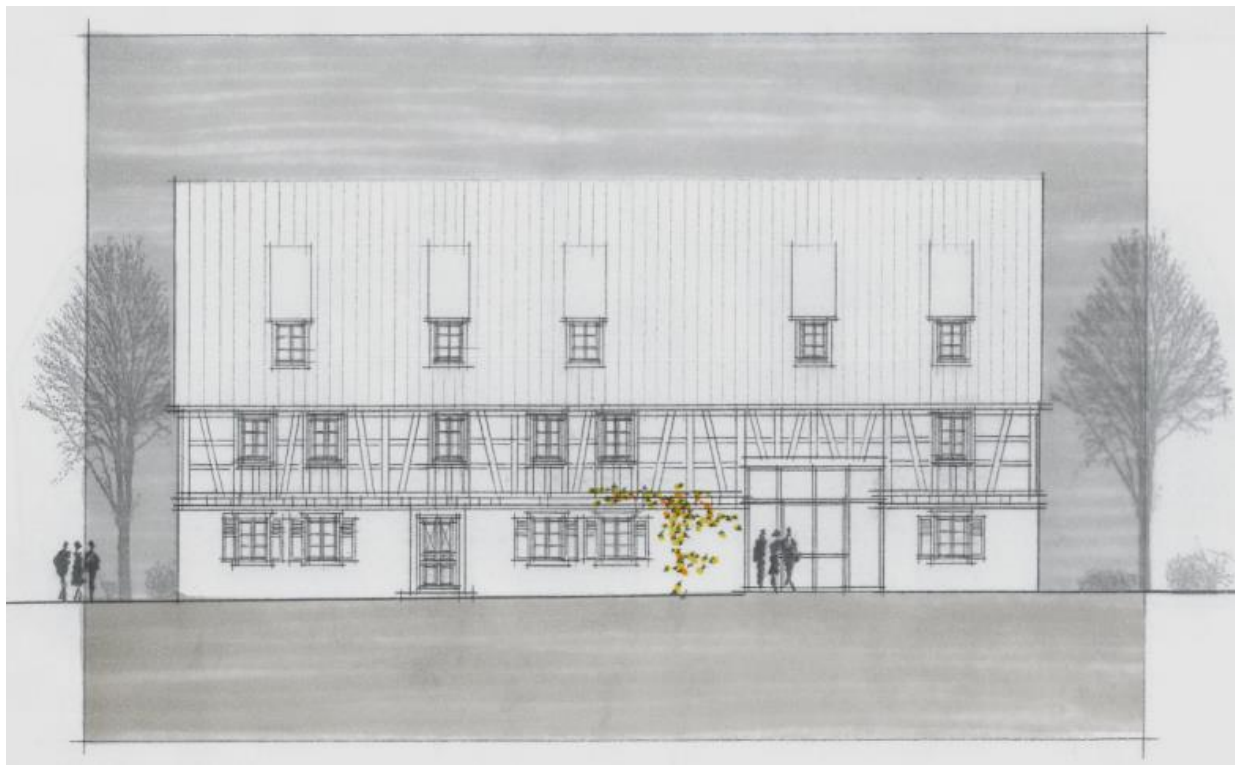
Entwurfsskizze nach der Sanierung