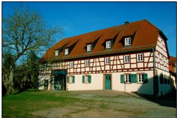
Ansicht nach der Sanierung