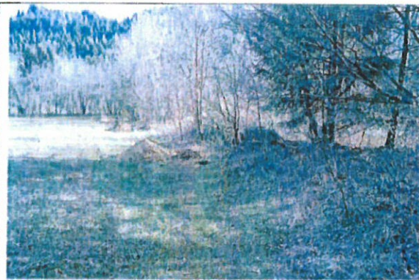
Foto 1: Übersicht Flurstücksgrenze. Rechts Aufhöhung der Altablagerung. Vorne Schurf 1, hinten Schurf 3.

Weitergehende Untersuchungen, wie z.B. eine Erkundung des Auffüllungsinventars auf dem Nachbargrundstück, sehen wir im Hinblick auf die derzeitig bekannte Umnutzung als unverhältnismäßig an.